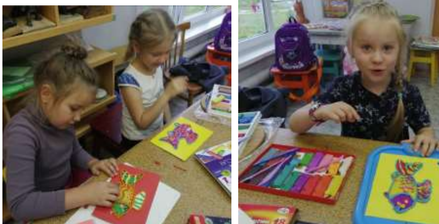
Младшие классы. Лепка из пластилина.

Работы учащихся выполненные на уроках лепки.