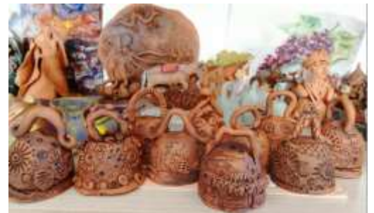
Сюжетная лепка из глины.