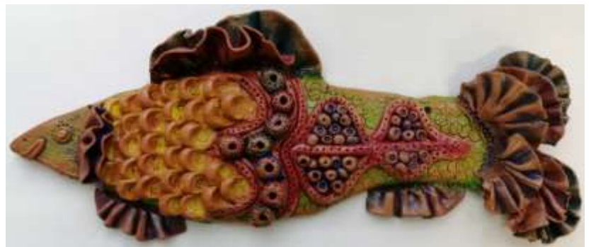
Барельеф. Натюрморт. Скульптурный пластилин.