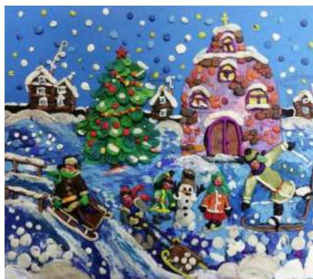
Сюжетная лепка. Пластилиновая живопись.