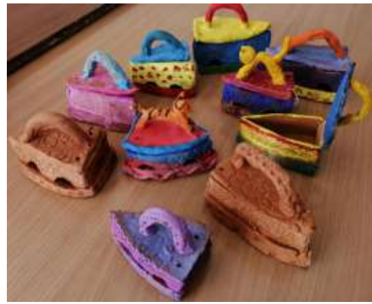
Лепка из глины. Конструирование.